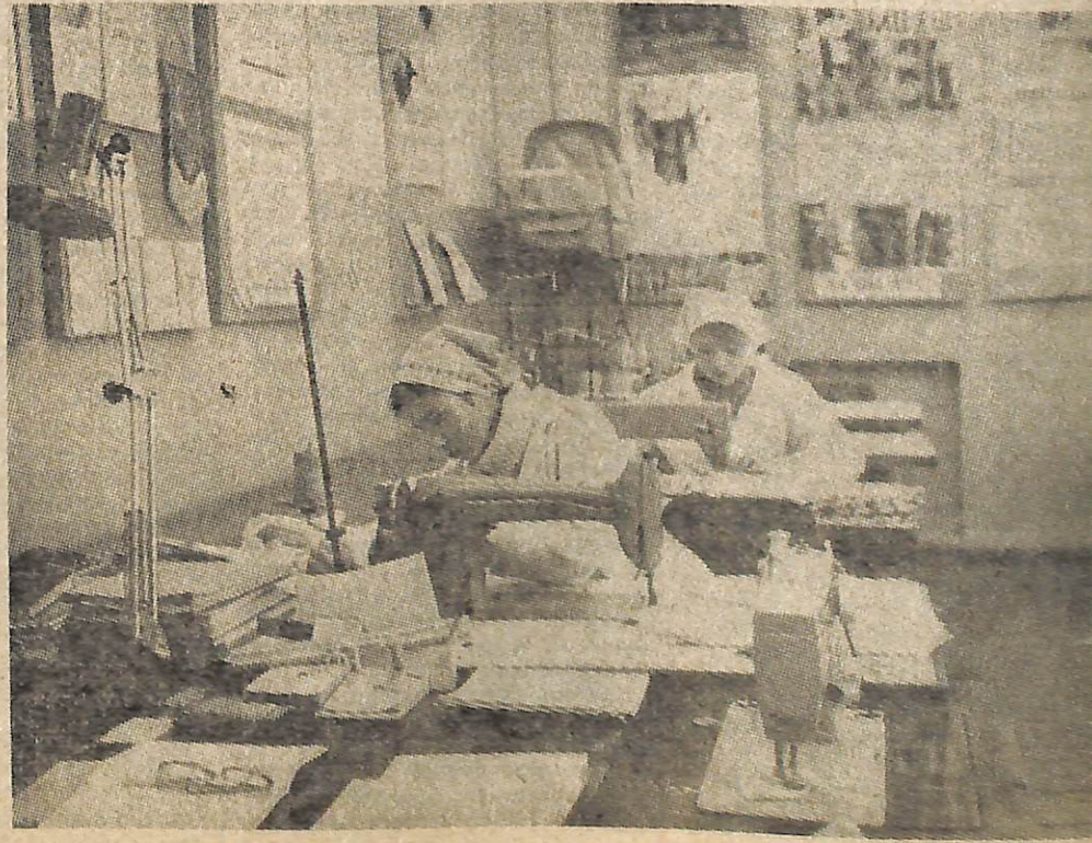
На снимке: идут занятия в учебно-производственном участке.

Владелец сертификата имеет право предъявить сертификат к оплате до истечения предусмотренного десятилетнего срока. В этом случае выплачивается ему доход, исходя из количества полных лет хранения денег на сертификате. За хранение сбережений на сертификате менее одного года со дня его продажи и после истечения десятилетнего срока хранения проценты по сертификату не начисляются. Выплата процентов по сертификату отдельно не производится, они могут быть выплачены только вместе с суммой, хранящейся на сертификате. При этом в расчет берется полное количество лет, в течение которых сумма хранилась на сертификате. Срок хранения сбережений на сертификате исчисляется со дня, следующего за днем его выдачи.